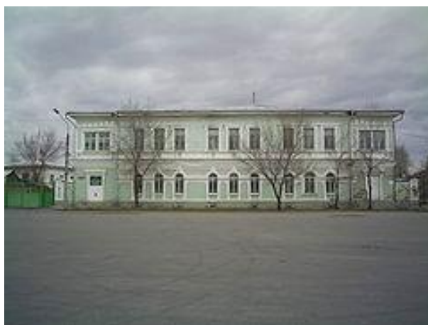
Дом купчихи Беловой