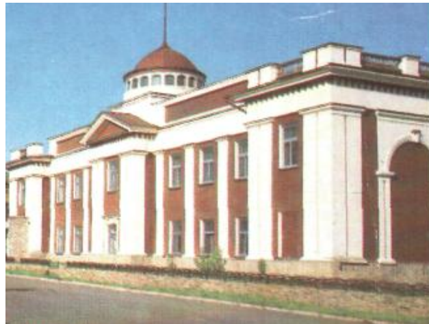
Старинный - первый корпус музея